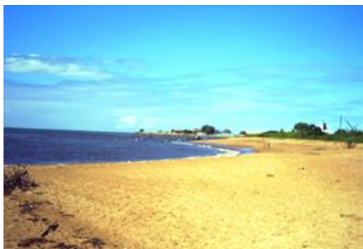
Nome do atrativo: Praia do Sauê.

Referências/Documentos consultados: in loco .