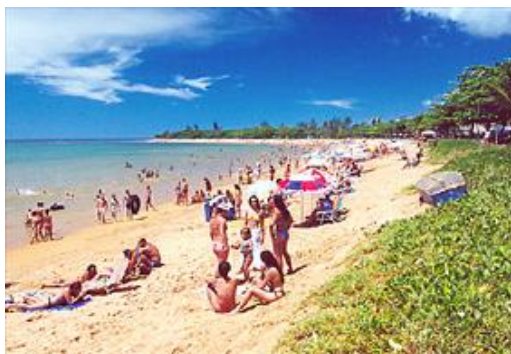
Nome do atrativo: Praia de Mar Azul.

Referências/Documentos consultados: in loco .