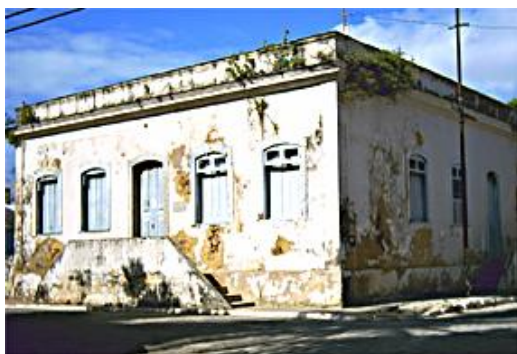
Nome do atrativo: Fonte do Caju.

Referências/Documentos consultados: in loco.