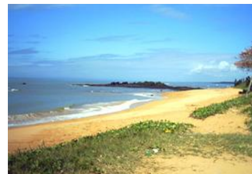
Nome do atrativo: Praia de Putiry.

Referências/Documentos consultados: in loco .